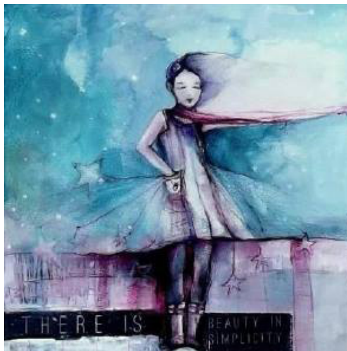
Obras de Guillermina Victoria